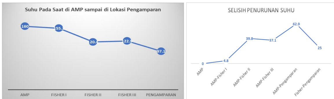
Gambar 1. Penurunan Suhu Aspal mulai dari AMP sampai ke Proses Pengamparan

Pemeriksaan berat jenis aspal dilakukan terlebih dahulu sebelum pengujian karena berat jenis aspal akan digunakan untuk menghitung proporsi campuran yang didapat dari pengujian dan perhitungan digunakan sebagai parameter untuk menentukan kadar aspal. Kinerja campuran aspal dapat di periksa dengan melakukan pengujian menggunakan alat, pemeriksaan dilakukan untuk mengetahui stabilitas campuran aspal dan agregat khususnya campuran AC-WC.