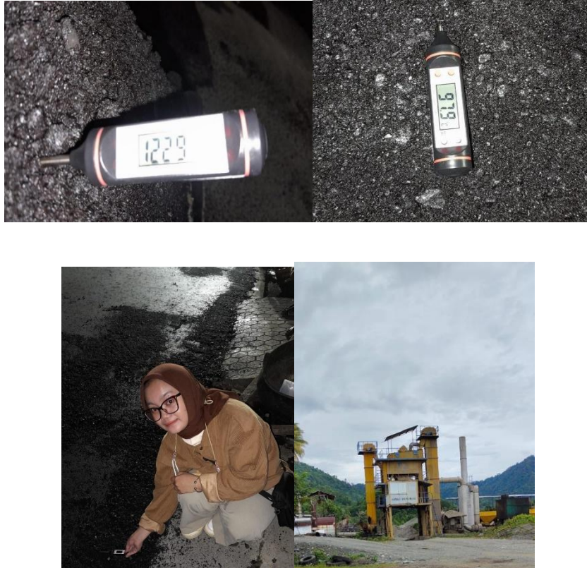
Gambar 2. Proses Pengambilan Sampel di Lokasi AMP dan Pengaspalan